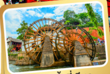
กังหันน้ำลี่เจียง