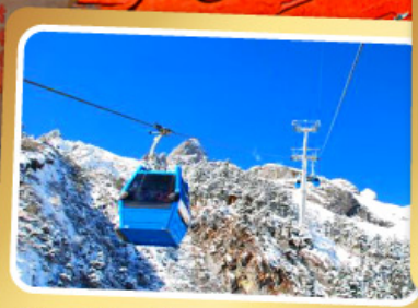
กระเช้าใหญ่ขึ้นภูเขาหิมะมังกรหยก