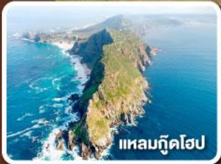
แหลมกู๊ดโฮป