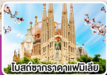
โบสถ์ซากราตาแฟมิลีย