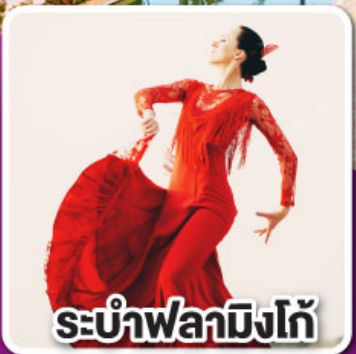
ระบำฟลามิงโก

ล่องเรือชมความน่ารัก ตามธรรมชาติของฝูงโลมา