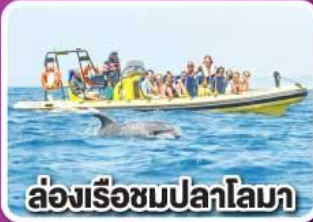
ล่องเรือชมปลาโลมา