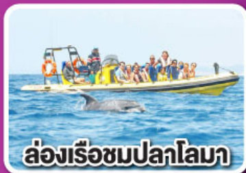
ล่องเรือชมปลาโลมา