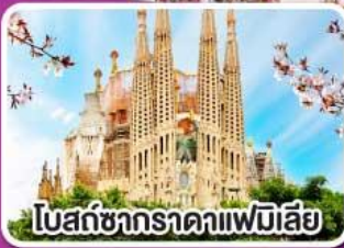
โบสถ์ซากราตาแฟมิลีย