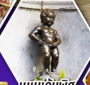
แมนเกินฟิส