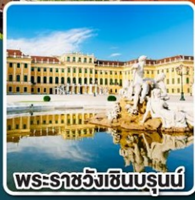
พระราชวังเซ็นบรุนน์

บินตรงไปกลับ ด้วยสายการบินชั้นนำระดับ 4 ดาว คุฟท์ฮันซ่าและออสเตรียนแอร์ไลน์