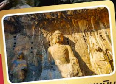
พวาทะสลักหลงเหมิน