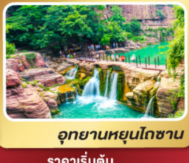
อุทยานหยุ่นโกซาน