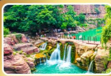
อุทยานหยุ่นโกซาน