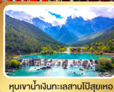
หุบเขาน้ำเงินทะเลสาบไป๋สฺยฺเหอ