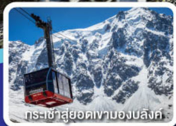
กระเช้าสู่ยอดเขามองบล็องค์