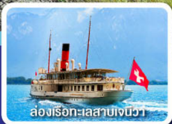
ล่องเรือทะเลสาบเจนีวา