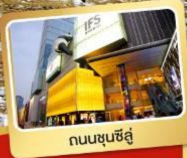
ถนนชุนชี่ลู่