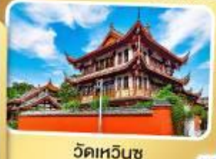
วัดเหวินชู่