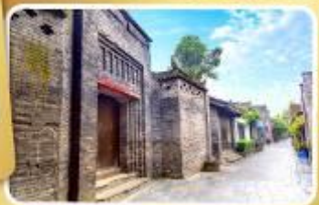
ถนนโบราณชอยกวางชอยแค