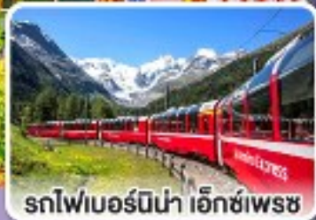
รถไฟเบอร์นีนา เอ็กซ์เพรส

รถไฟสายโรแมนติกและยอดเขาสุดพีคสุด อิตาลี สวิตเซอร์แลนด์ ออสเตรีย สโลวาเกีย 10 วัน 7 คืน