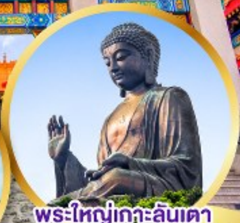
พระใหญ่เกาะลันเตา