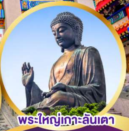
พระใหญ่เกาะลันเตา

บุฟเฟต์ชาบูสไตล์ฮ่องกง (เครื่องดื่ม น้ำอัดลม + เบียร์ ไม่อั้น!!)