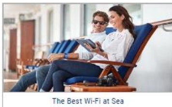
The Best Wi-Fi at Sea