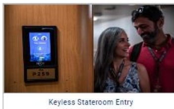
Keyless Stateroom Entry