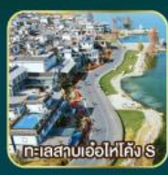
ทะเลสาบเอ๋อไห่คัง S