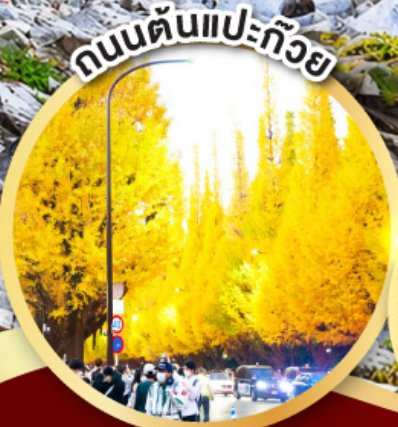
ถนนต้นไม้แปะทิว