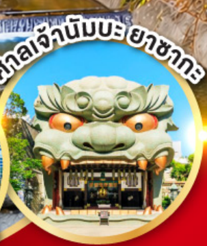
ศาลเจ้านิมบะฮะซากะ