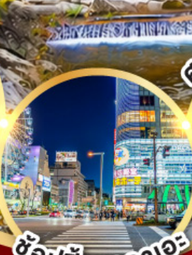
ช้อปปิ้งซาคาเอะ