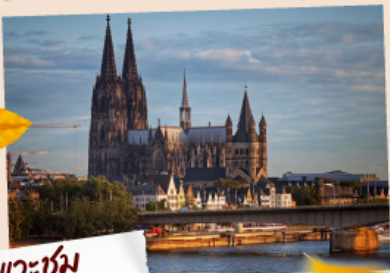
แควซ่ม มหาวิหารโคโลญ