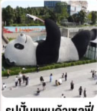
รูปปั้นแพนด้าเซล์ฟี่