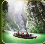
สวน Alice's Garden ล่องเรือแม่น้ำไต้ดินกูฮิว