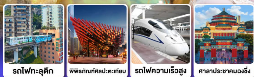
รถไฟฟ้าสุทิด