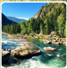
อุทยานเคอเคอทั้วไห่