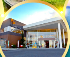
มิตซูเอากะอิเล็คทริกพาร์ค คาโตะ