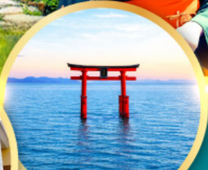
ทะเลสาบบิวะ เสาโทริอิ

เส้นทางสายอัลไพน์ทากายามา กำแพงหิมะ เขื่อนคุโรเบะ