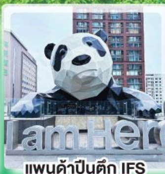
แพนด้าปิ่นตัก IFS