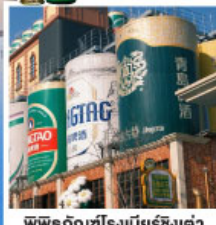
พิพิธภัณฑ์โรงเบียร์ชิงเต่า