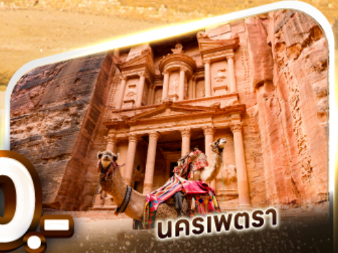
นคริพตรา