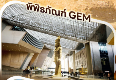
พิพิธภัณฑ์ GEM