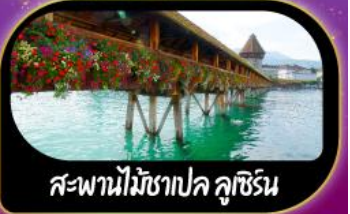
สะพานไม้ชาเปล คูชีริน