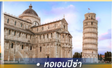
• หอนอนปิซ่า