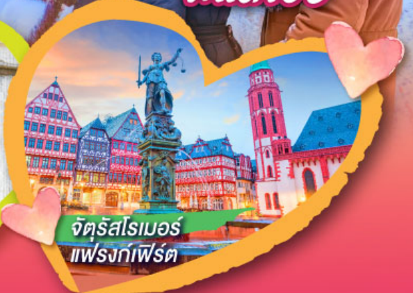
จัตุรัสโรเมอร์ แฟรงก์เฟิร์ต