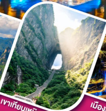
เจาเทียนเหมินตัน