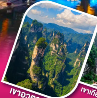
เจิวจาวตาร