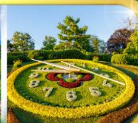
นาฬิกาดอกไม้เมืองเจนีวา

เดินทาง 9 วัน 6 คืน 09-17 ก.พ.69 22-30 มี.ย.69