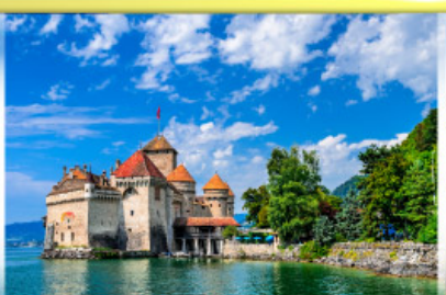
ปราสาทชิลอง