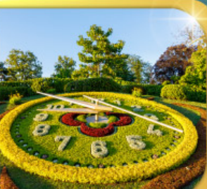
นาฬิกาดอกไม้เมืองเจนีวา