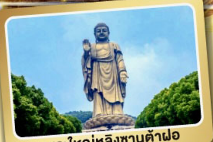
พระใหญ่หลิงซานต้าฝอ

เมนูพิเศษ! ซีโครงหมูอู๋ซี, เสี่ยวหลงเปา, ชาบูหมาล่า