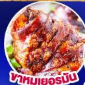
ขาหมูเยอรมัน