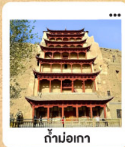
ถ้ำม่อเกา