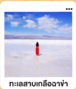
ทะเลสาบเกลือฉางซ่า