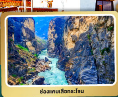
ช่องแคบเล็กระโจน