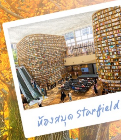
ห้องสมุด Starfield