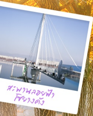
สะพานลอยฟ้า โซฮางดง