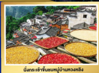
มิ่งกระเข้าขันหมอบ้านหวงหลิง