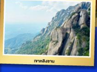
เขาหลงซาน