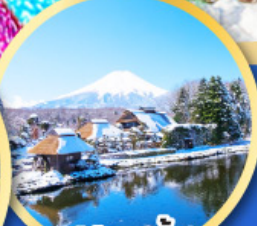
หมู่บ้านน้ำใส ไอชิโนะอัทสึ