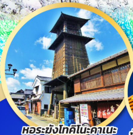
หอรบั้งโทคิโนะคานะ