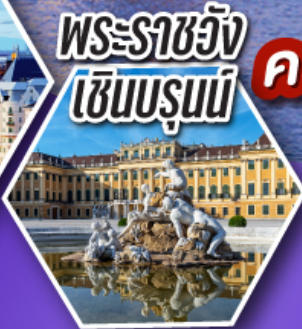
พระราชวัง เซินบรุนน์