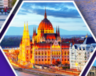
บูดาเปสต์