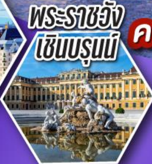
พระราชวัง เซินบรุนน์