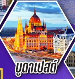
บูดาเปสต์