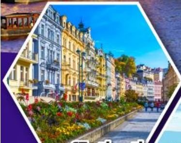
คาร์โลวารี