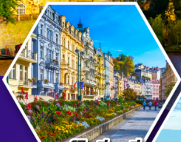
คาร์ลสบาด