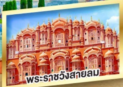
พระราชวังสกายลม