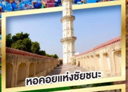
หอคอยแห่งชัยชนะ