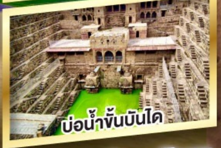
บ่อน้ำขั้นบันได