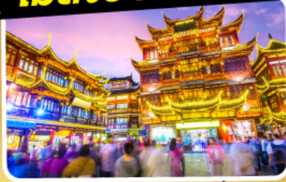
ตลาดร้อยปีเฉิงหวังเมี่ยว