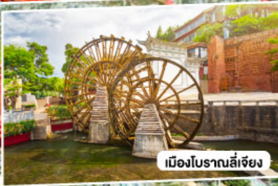
เมืองโบราณลี่เจียง