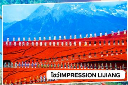
โชว์ IMPRESSION LIJIANG