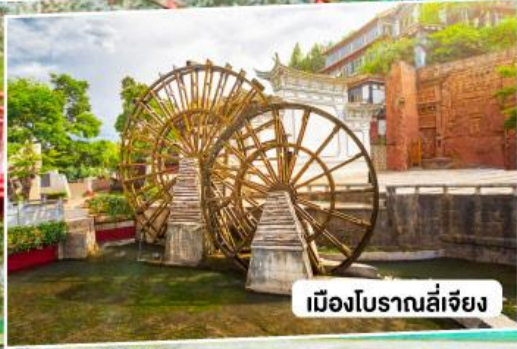
เมืองโบราณลี่เจียง