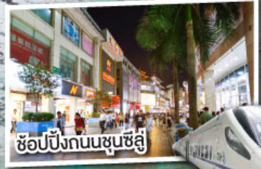
ช้อปปิ้งถนนชุนซีลู่