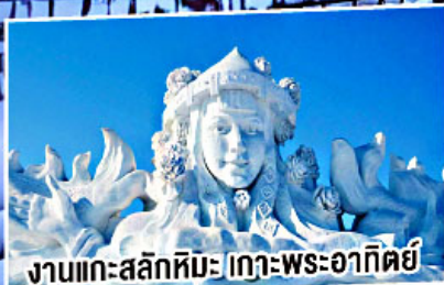
งานแกะสลักหิมะ เกาะพระอาทิตย์