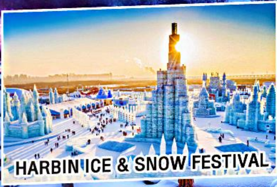
HARBIN ICE & SNOW FESTIVAL