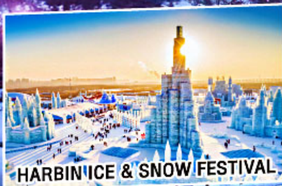
HARBIN ICE & SNOW FESTIVAL