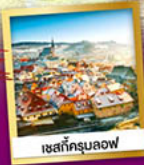
เซสท์ครุนลอฟ