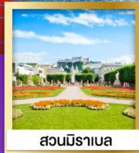
สวนมิราเบล