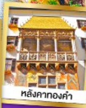
หลังคาทองคำ