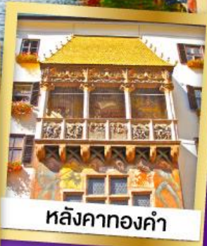
หลังคาทองคำ