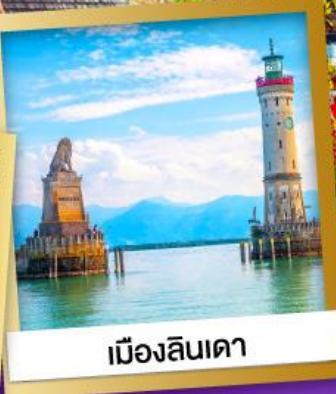
เมืองลินเดา