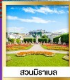
สวนมิราเบล