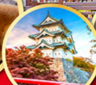
ปราสาทฮิโรซากิ