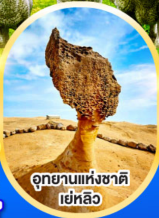
อุทยานแห่งชาติ เย่หลิว