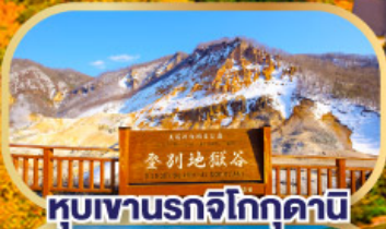
หุบเขานรกจิโกกุคามิ

นั่งกระเช้าชมวิวฮาโกดาเตะ (รวมค่ากระเช้า)