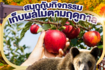
สนุกกับกิจกรรม เก็บผลไม้ตามฤดูกาล