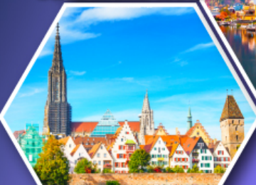
อุล์มบ้านเกิดไอน์สไตน์