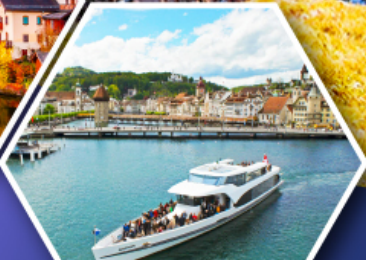
ล่องเรือทะเลสาบลูเซิร์น

การ์นตี แพคเกจข้ามคืนบนยอดเขาพีลาตุส ยอดเขาคินมิงกรแห่งสวิตเซอร์แลนด์