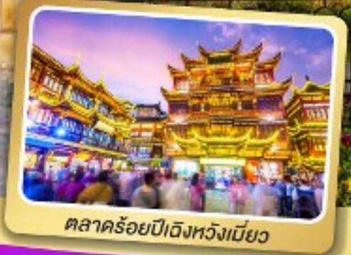
ตลาดร้อยปีดิ้งหวงเหมี่ยว