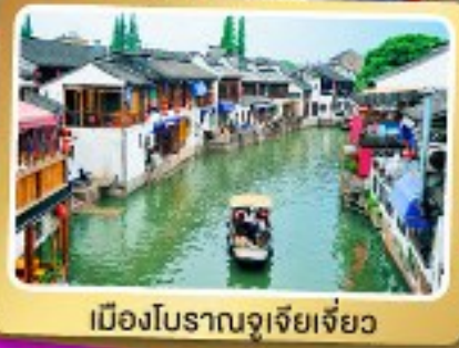
เมืองโบราณซูโจวเจียว