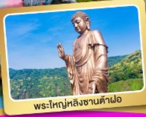
พระใหญ่หลังซานต้าฟอ