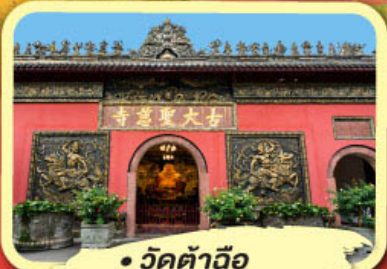
• วัดต้าอิว